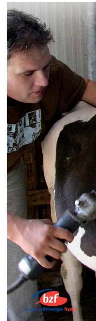
De gevestigde ondernemer