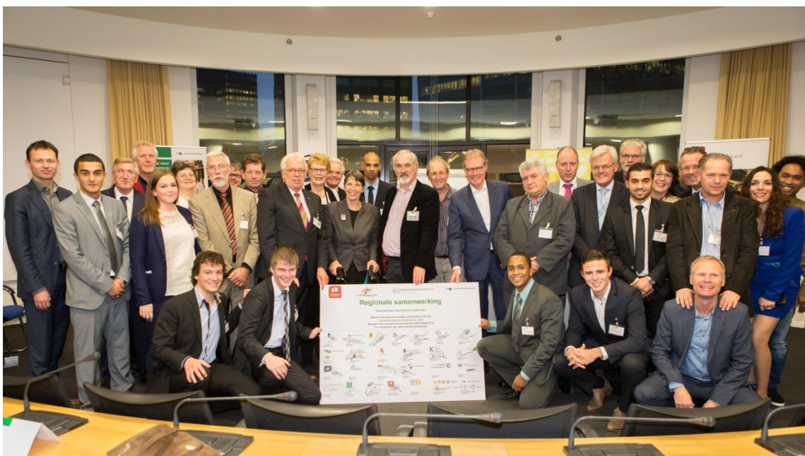
Foto nav uitrol Rotterdamse Zaak in november 2013

Na de presentaties namen we een kijkje in de werkruimtes waar we de studenten daadwerkelijk aan het werk zagen.